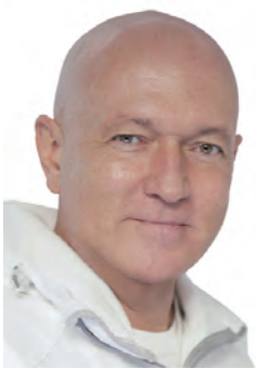
Dr. Bringmann kommentiert:

Schon seit Jahren leide ich unter ständiger Müdigkeit, geringer Belastbarkeit und Konzentrationsschwäche. Schlafstörungen und Depressionen kommen auch immer öfter vor. Die lästige Allergien machen mir auch das ganze Jahr aber besonders im Frühjahr zu schaffen. Angeblich sind meine Blutwerte in Ordnung aber ich fühle mich so elend und keiner kann mir dabei helfen. Was soll ich tun?